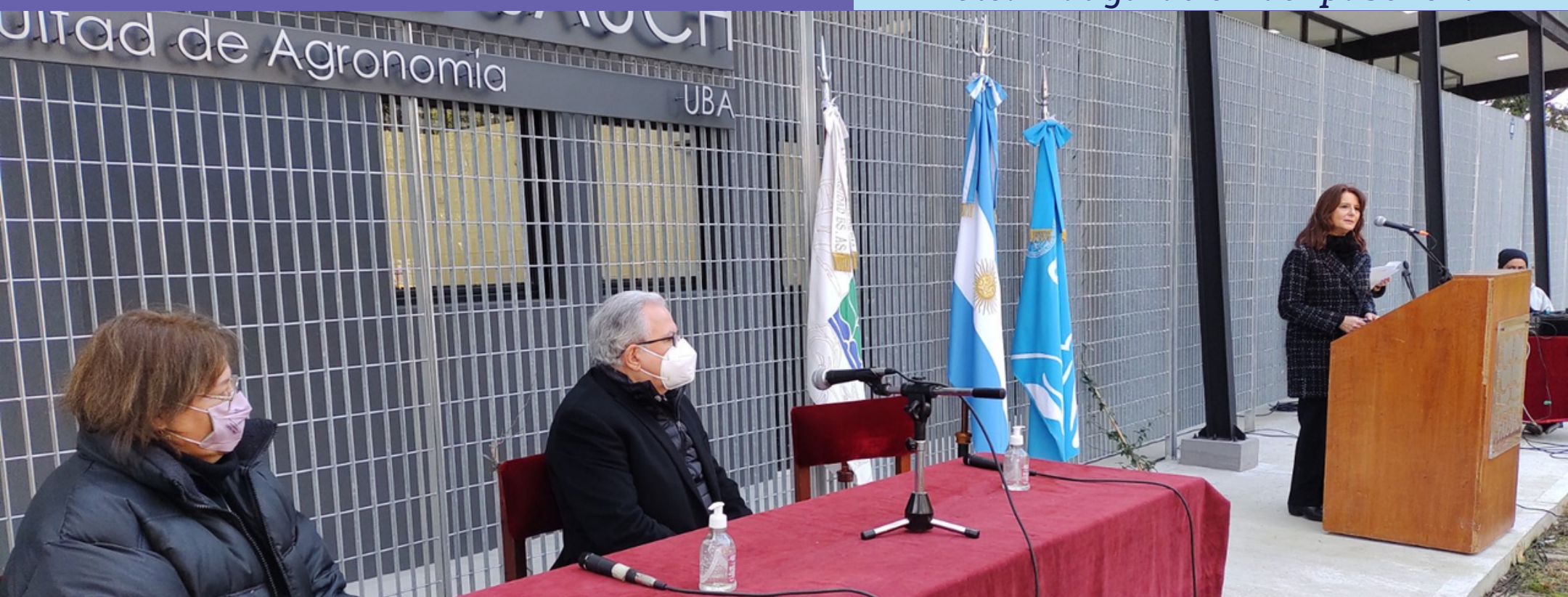
Foto: inauguración del pabellón.

En 2021 se inauguró el nuevo Pabellón de Microbiología y Agroalimentos , que lleva su nombre.